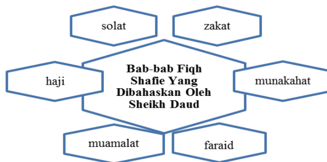
Rajah 1 - Bab Fiqh Shafie yang dibahas oleh Sheikh Daud dalam karyanya

Analisis teks daripada tujuh buah karya fiqh al-Shafie menunjukkan Sheikh Daud pakar dalam syariat Islam. Malah beliau berusaha untuk memahami masyarakat Melayu tentang syariat Islam khususnya cara pelaksanaan ibadah dengan betul mengikut mazhab al-Shafie. Malah beliau turut mengemukakan pandangan ulama-ulama Fiqh Shafi'iyah muta'akhirin. Oleh itu, dapat disimpulkan perbincangan tentang fiqh Shafie oleh Sheikh Daud meliputi bab-bab berikut: