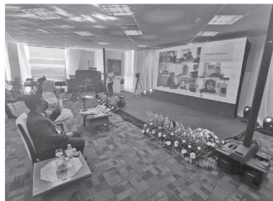
Pementasan Teater Bukit Kepong antara Darah dan Sejarah secara hybrid