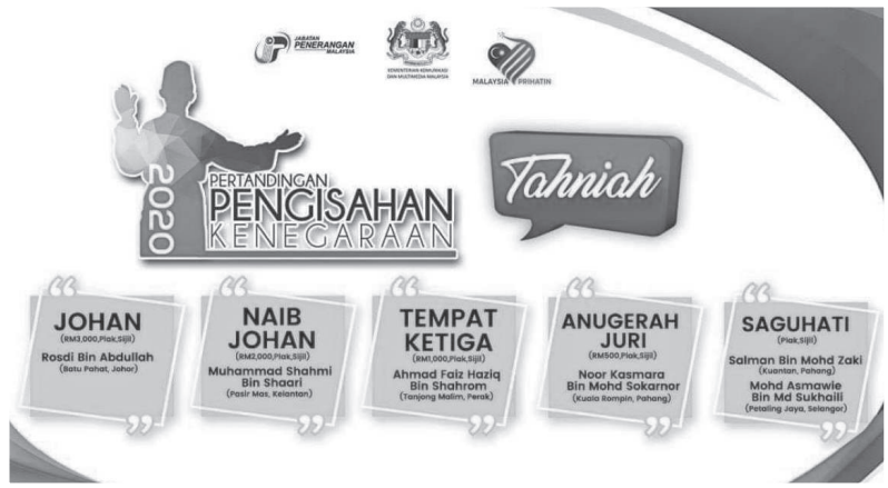
Pementasan Teater Bukit Kepong Antara Darah dan Sejarah secara hybrid telah menjuarai pertandingan Pengisahan Kenegaraan Jabatan Penerangan peringkat kebangsaan 2020.