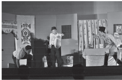
Pementasan Teater Ningrat