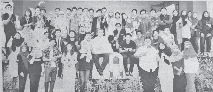
Mereka yang terlibat dalam persembahan teater berkenaan bergambar kenangan setelah berjaya merangkul tiga anugerah.

BATU PAHAT – Universiti Tun Hussein Onn Malaysia (UTHM) berjaya melakar sejarah tersendiri apabila meraih tiga anugerah dalam Festival Teater Negeri Johor 2015.