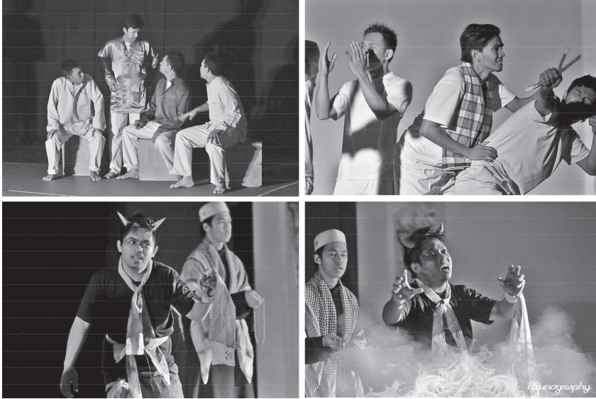
Pementasan Teater Janin (Bisikan Qarin)