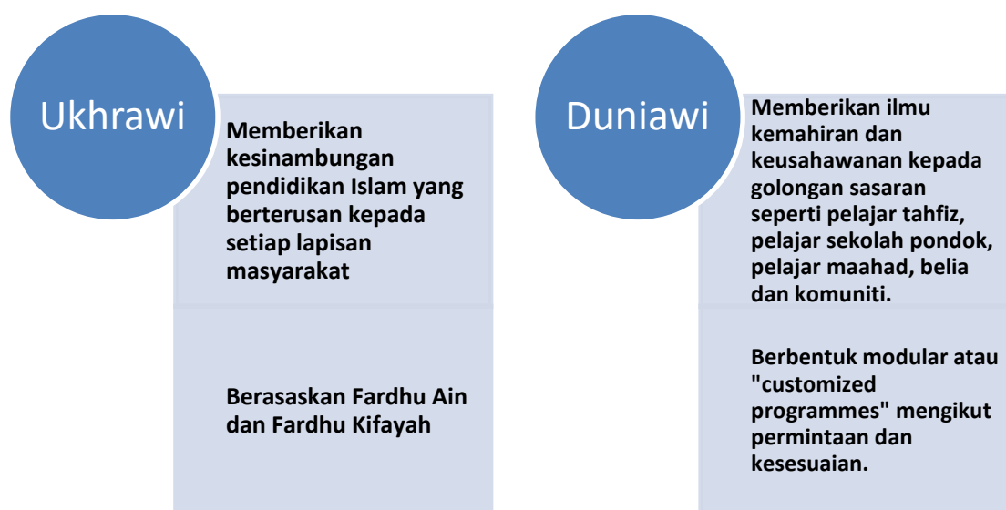
Rajah 4: Kategori Program PISH