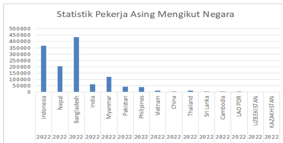
Rajah 5 Statistik Pekerja Asing Aktif mengikut Negara 2022

Statistik pekerja asing mengikut negara bagi lima tahun dari tahun 2018 hingga 2022 menunjukkan jumlah kehadiran pekerja asing mempunyai variasi kadar peningkatan dan penurunan. Pada tahun 2018, kehadiran pekerja asing adalah 1982798 orang, tahun 2019 menunjukkan kadar peningkatan kehadiran pekerja asing sebanyak 16753 orang kepada 1999551 orang. Pada tahun 2020, kadar kehadiran pekerja asing menunjukkan penurunan kepada 1545095 orang dan terus menurun kepada 1171909 orang pada tahun 2021. Penurunan kehadiran pekerja asing kemungkinan besar disebabkan oleh wabak covid-19 yang melanda dunia. Pada tahun 2022, kehadiran pekerja asing ke Malaysia menunjukkan peningkatan ketara iaitu 1303398 orang.