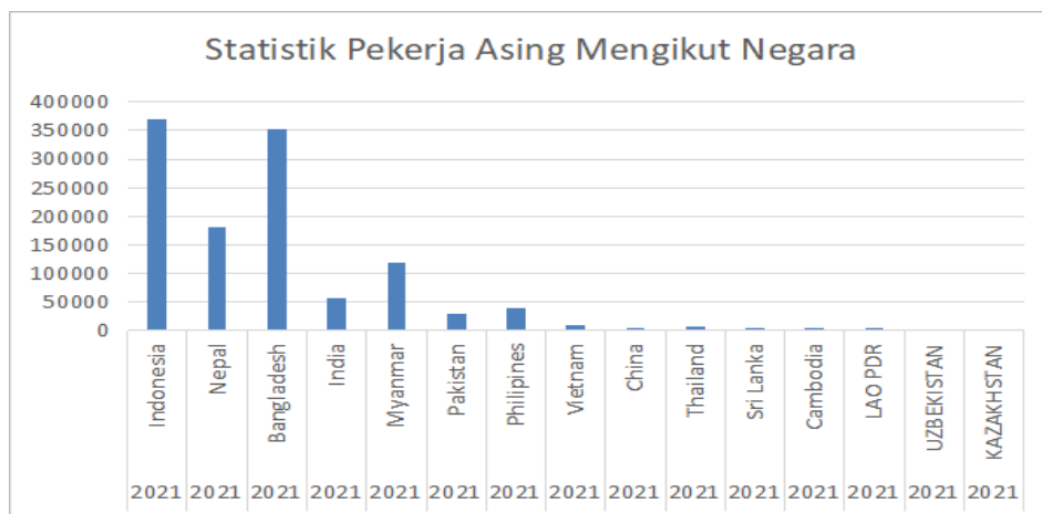
Rajah 4 Statistik Pekerja Asing Aktif mengikut Negara 2021