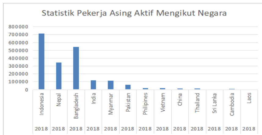
Rajah 1 Statistik Pekerja Asing Aktif mengikut Negara 2018

Berdasarkan data yang diperoleh dari Jabatan Imigresen Malaysia 2022, statistik menunjukkan kemasukan pekerja asing ke Malaysia mengikut negara bagi tahun 2019 hingga 2022 dapat dilihat menerusi rajah 1 hingga 5 di bawah: