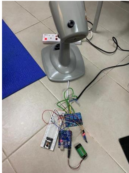
Rajah 3 Rekabentuk projek

Rajah 3 merupakan gambar rajah projek FYP iaitu kipas automatik dengan penderia IR dan penderia LM35. Dua ujian dan pemerhatian telah dijalankan bagi mengenalpasti dan mengetahui had projek ini supaya dapat ditambahbaik.