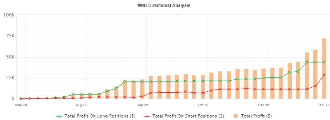
Rajah 7: Analisis Arah #MU

Keuntungan akhir yang dihasilkan oleh pesanan beli dan pesanan jual adalah 11110 pip daripada keuntungan 12136 pip. Manakala kerugian akhir yang dihasilkan oleh pesanan beli dan pesanan jual adalah 1026 pip. Hasil yang lebih terperinci menggunakan penunjuk ini untuk saham MU diberikan dalam Rajah 8 .