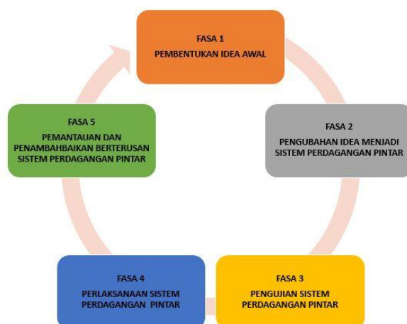
Rajah 3: Kitaran Pembangunan Sistem Perdagangan Pintar MACD (SPP_MACD)

Kajian ini dikembangkan berdasarkan kepada kajian kesauran terkait seperti yang disebutkan di bagian sebelumnya. Bahagian ini meringkaskan reka bentuk kajian yang dipanggil Kitaran Pembangunan Sistem Perdagangan Pintar_MACD [9]. Rajah 3 menggambarkan metodologi kajian untuk mencapai tujuan yang ditentukan.