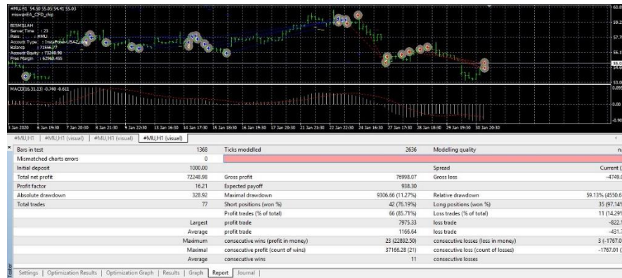
Rajah 6: Pengujian berbalik SPP_MACD

pemproses komputer, hasilnya di bahagian seterusnya akan muncul dalam beberapa saat atau minit. Hasil yang diperolehi dari pengujian berbalik terhadap saham MU digambarkan dalam Rajah 6 .