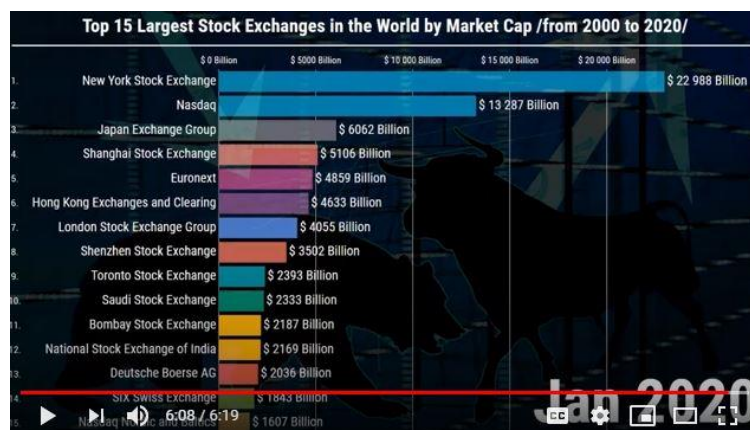
Rajah 1: Senarai 15 bursa saham dunia berdasarkan nilai modal pasaran

NASDAQ ialah singkatan National Association of Securities Dealers Automated Quotation sebuah bursa saham atau pasaran perdagangan sekuriti ekuiti berskrin elektronik terbesar di Amerika Syarikat. Dengan kira-kira 3,700 syarikat dan perbadanan, bursa ini menikmati jumlah dagangan sejam yang terbanyak di kalangan semua bursa saham di dunia [1]. Sehingga Jan 2020 modal pasaran NASDAQ berjumlah USD 13287.00 bilion dan berada di kedudukan nombor 2 di belakang Bursa Saham New York (NYSE) seperti dalam Rajah 1 di bawah.