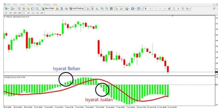
Rajah 2: Isyarat Belian dan Jualan oleh penunjuk MACD

Penafsiran penunjuk MACD mudah difahami oleh pedagang. Dalam kajian ini setiap kali penunjuk MACD melintasi garisan sifar ke atas, bermaksud ada peluang pedagang itu untuk membeli sesuatu saham. Sementara jika penunjuk MACD melintasi sifar ke bawah maka pedagang itu mempunyai peluang untuk menjual sesuatu saham seperti yang ditunjukkan pada Rajah 2 . Salah satu kelebihan asas MACD adalah potensinya untuk menggabungkan aspek arah aliran/trend dan momentum dalam satu penunjuk [7].