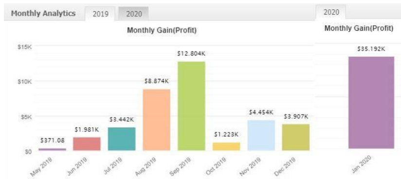
Rajah 10: Keuntungan dengan pengujian berbalik SSP_MACD