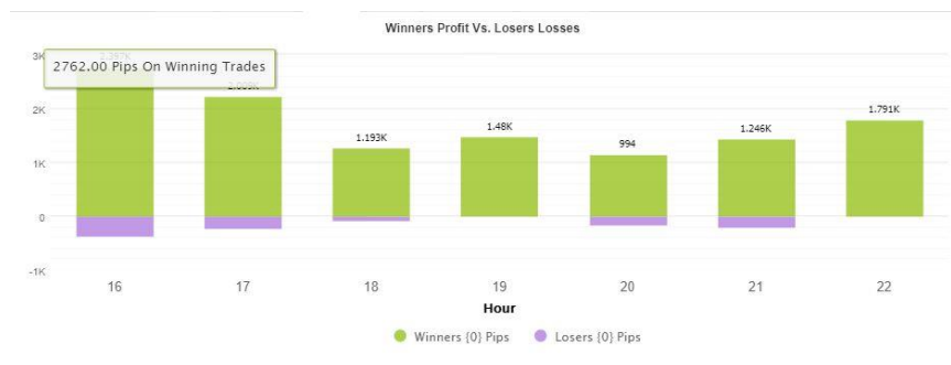
Rajah 8: Keuntungan saham MU berdasarkan Pip

Keuntungan akhir yang dihasilkan oleh pesanan beli dan pesanan jual adalah 11110 pip daripada keuntungan 12136 pip. Manakala kerugian akhir yang dihasilkan oleh pesanan beli dan pesanan jual adalah 1026 pip. Hasil yang lebih terperinci menggunakan penunjuk ini untuk saham MU diberikan dalam Rajah 8 .