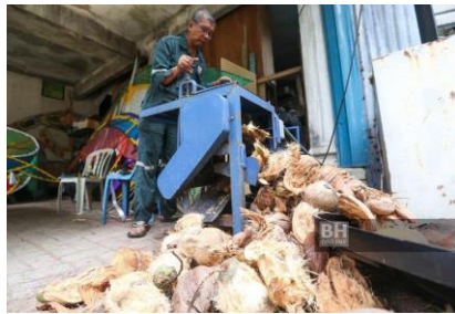
Rajah 2 Mesin Pengupas Separuh Automatik [5]

Petani boleh menggunakan alat pengupas kelapa semi automatik jika ladang mereka tidak begitu besar, atau ia boleh digunakan untuk perladangan berkelompok atau berkumpulan. Terdapat banyak mesin pengupas kelapa yang memerlukan elektrik untuk menjalankan motornya. Model-model mesin mengupas kelapa mempunyai mata yang tajam untuk mengupas sabut kelapa. Rajah 2 menunjukkan mesin pengupas separuh automatik yang berkemampuan mengupas 100 biji kelapa dalam 7 minit [5][7].