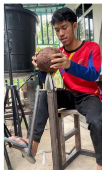
Rajah 6 Ujilari Fungsi Alat Mesin Pengupas Kelapa

Akhirnya, hasil ujian dianalisis dengan membandingkan penggunaan alat moden ini dengan teknik tradisional. Penilaian merangkumi aspek kelebihan, kekurangan, keselamatan, dan keberkesanan. Berdasarkan analisis tersebut, kesimpulan dibuat mengenai tahap kebolehppercayaan alat, di samping mengenal pasti ruang penambahbaikan untuk meningkatkan prestasi dan fungsi keseluruhannya. Rajah 6 menunjukkan ujilari terhadap fungsi alat.