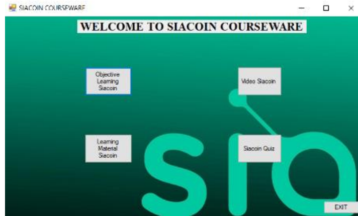
Rajah 2: Halaman menu utama

Kami membangunkan perisian kursus ini di dalam Visual Studio. Rajah 2 menunjukkan halaman menu utama yang mempunyai beberapa butang seperti butang objektif pembelajaran Siacoin, butang video pembelajaran Siacoin, butang bahan pembelajaran Siacoin, butang kuiz Siacoin dan terakhir butang keluar yang dapat ditekan oleh para pengguna.