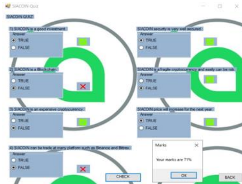
Rajah 5: Halaman kuiz

Rajah 5 merupakan halaman yang mengandungi tujuh soalan mengenai mata wang kripto Siacoin. Setiap soalan mempunyai dua pilihan jawapan iaitu betul atau salah. Selepas pengguna habis menjawab pengguna perlu menekan butang semak dan paparan jumlah peratusan markah akan muncul. Disebelah setiap soalan akan memaparkan simbol betul atau salah selepas pengguna menekan butang semak.