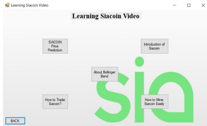
Rajah 3: Halaman video pembelajaran

Rajah 3 merupakan halaman video pembelajaran. Sekiranya pengguna menekan sesebuah butang, pengguna akan dibawa terus ke laman YouTube video berkenaan.