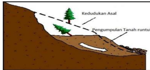
Rajah 1: Runtuhan tanah (Towonsing, 2016)

Tanah runtuh didefinisikan sebagai fenomena geologi yang melibatkan sejumlah besar pergerakan tanah, seperti jatuhnya batu, kegagalan cerun, dan aliran serpihan cetek. Selain itu, tanah runtuh adalah dikaitkan dengan gelongsoran tanah yang berlaku dan boleh menimbulkan kejadian yang tidak diinginkan seperti merosakkan harta benda, menyebabkan kematian akibat ditimpa oleh runtuhan tanah seperti yang ditunjukkan dalam Rajah 1 (Hussin et al. , 2015). Rajah 1 turut menunjukkan perbezaan di antara kedudukan asal tanah dan pengumpulan tanah selepas berlakunya tanah runtuh di kawasan lereng bukit.