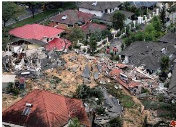
Rajah 2: Kejadian tanah runtuh menimpa kawasan perumahan (Mufami, 2011)

Pembangunan di kawasan lereng bukit bukanlah perkara baharu malahan telah banyak dilaksanakan di negara luar. Namun demikian, keselamatan terhadap penduduk sekitar juga perlu dititikberatkan. Dalam konteks ini pembangunan di lereng bukit boleh mempengaruhi keselamatan penduduk sekitar seperti yang ditunjukkan dalam Rajah 2. Rajah tersebut menunjukkan kejadian tanah runtuh yang berlaku di kawasan perumahan berdekatan lereng bukit dan telah mengancam keselamatan penduduk.